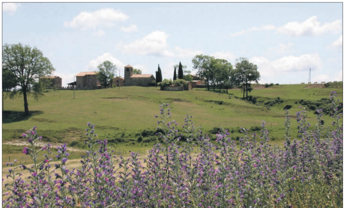
Sant Pere de Falgars

estaven inclosos, en el moment de la unió, dins dels quatre municipis que van firmar l'acord.