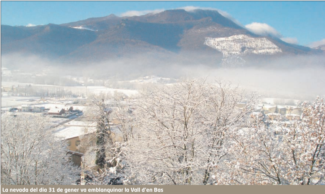
La nevada del dia 31 de gener va emblanquinar la Vall d'en Bas