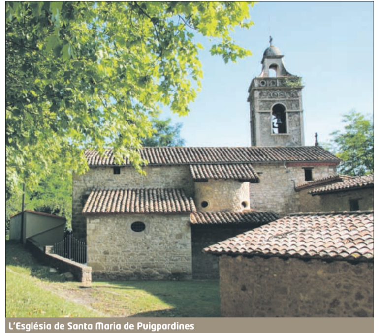
L'Església de Santa Maria de Puigpardines