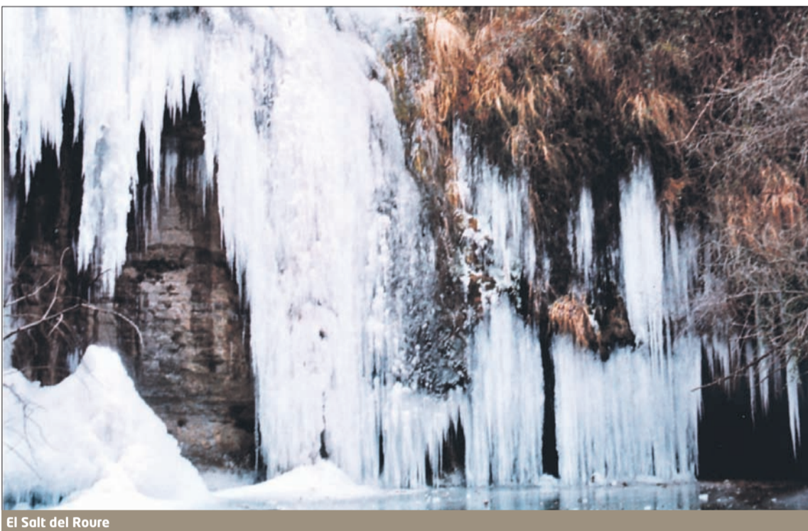
El Salt del Roure

d'en Bas. El Mallol és un espai d'interès històric nascut l'any 1176 i el seu topònim sembla que podria provenir del cultiu de maïoles, unes vinyes que actualment ja han desaparegut de la comarca. Assentat sobre un pujol, durant l'època medieval va ser la capital del vescomtat de Bas i va acollir una de les residències dels senyors feudals. Actualment del poble en destaquen nombroses construccions com la casa del Veguer, la